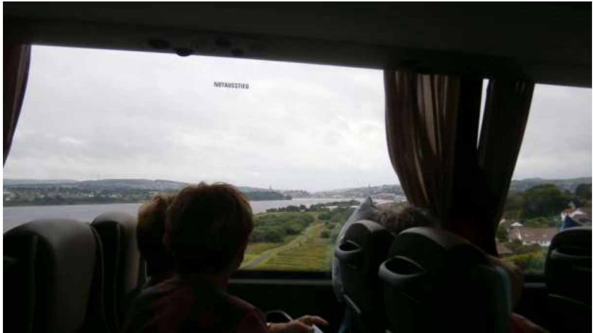
Po cestě projíždíme Londoderry