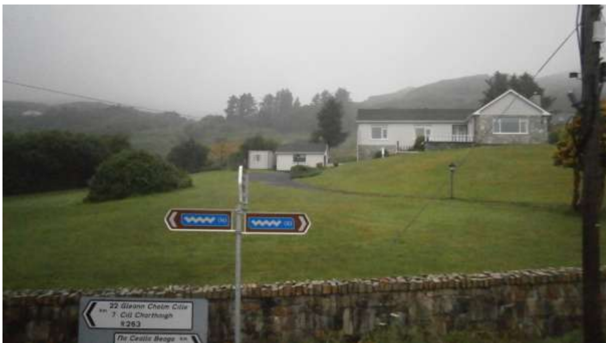
Takto vypadá náš další hostel