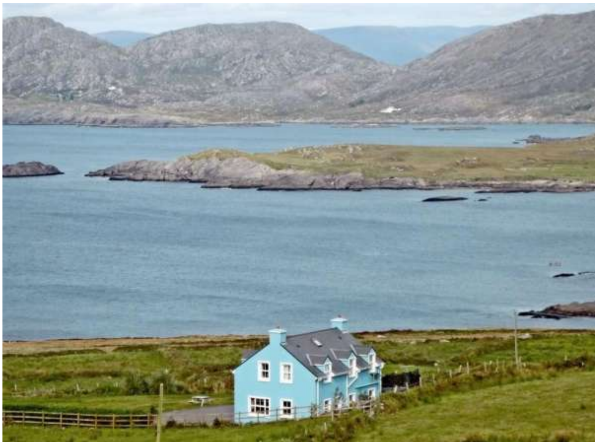
Náš cíl je na dohled – je to Adrigole na poloostrově Beara