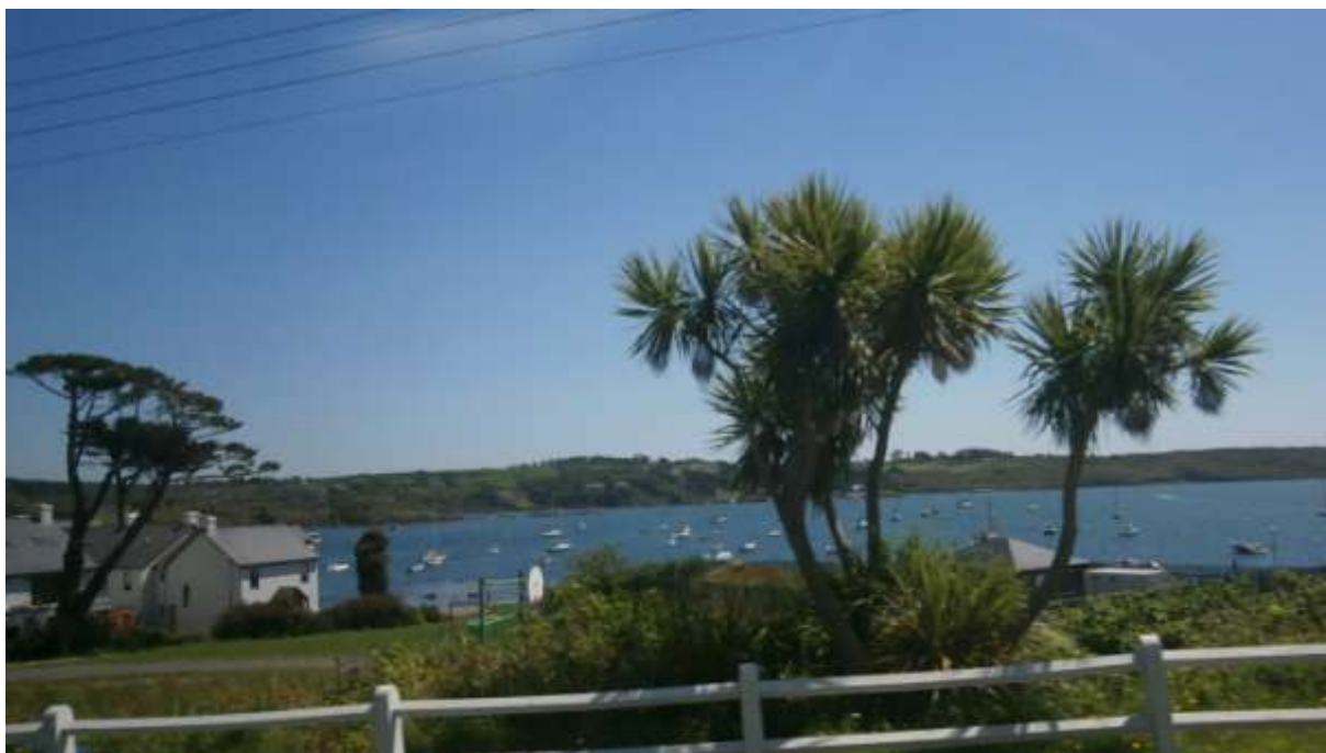
Starý most v Glengarrifu