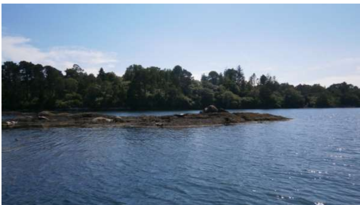
Povalující se lachtani na kamenitých ostrůvcích