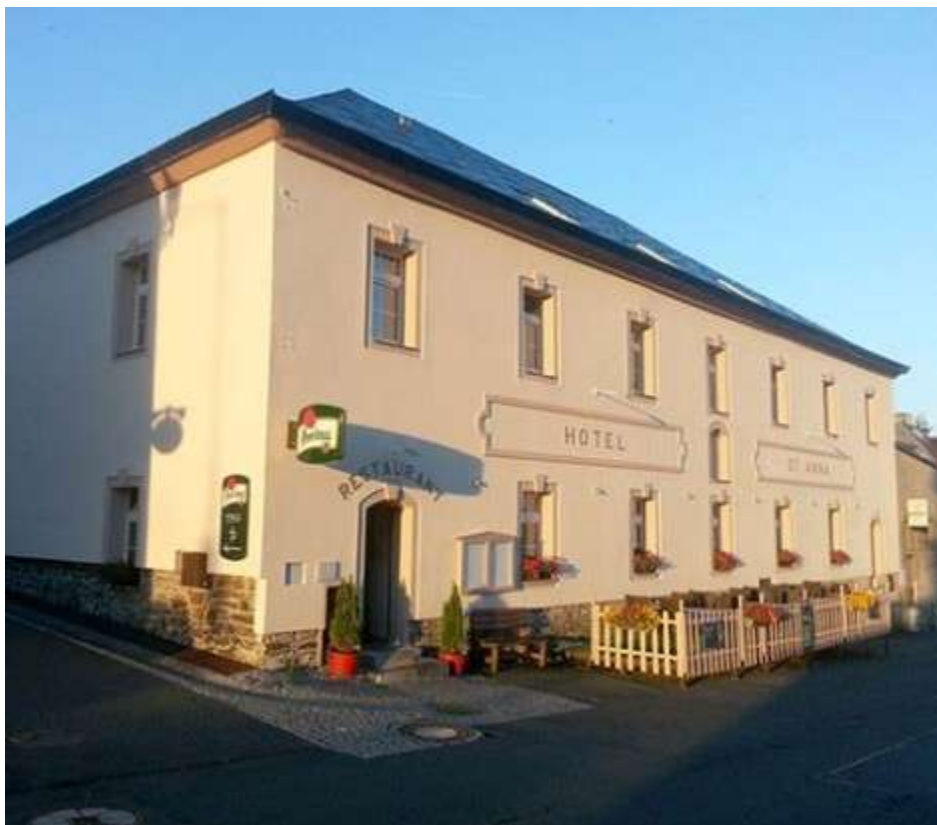
ALE - největší

městský chudobinec založený zde místním rodákem a farářem Franzem Tippmannem. Ten se později stal pražským světícím biskupem.